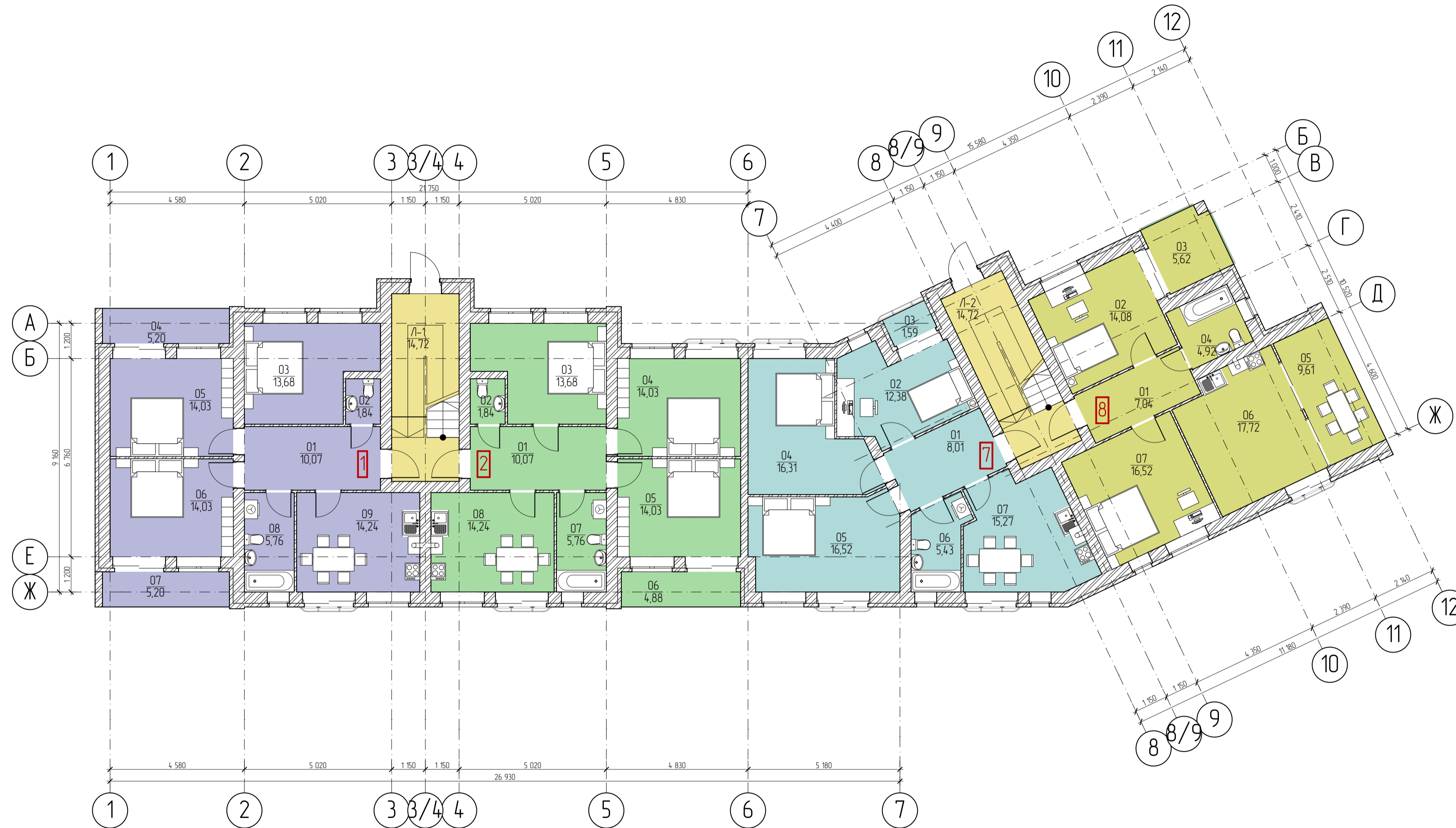
План 1-го этажа на отм. 0,000. М 1:100.